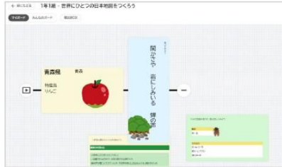
▶サイズや配置も自由に変更可能