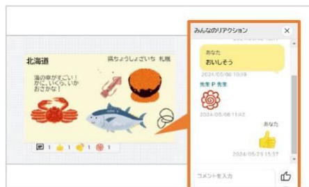
▶相互にリアクション

作った「カード」はみんなのボードで共有可能。リアクションボタンやコメントを使った意見交流や、集計機能を使った意見の可視化など、みんなで思考する授業が簡単にできます。