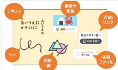
▶多様な表現アイテムでカードを作成

一人ひとりが「カード」を作成し、自分のアイデアや考えをアウトプットできます。多様な表現アイテムで、子どもの自由な表現をサポートします。