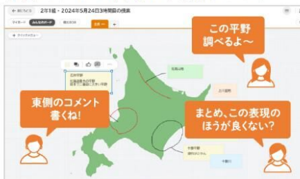
▶カード・ボードの共同編集

複数人で一つの「カード」を作成・共同編集することが可能。課題に対してアイデアや考えを出し合って、グループで一つの意見にまとめる、というような学習を、より簡単に実現します。