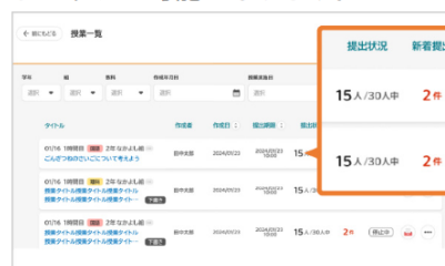
▶提出物を一覧管理

オクリンクプラス上で、提出物の一覧管理や添削ができます。子どもの提出物にスタンプを押したり、一人ひとりにコメントを書くなど、スムーズなフィードバックが可能になります。