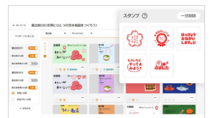
▶スタンプやコメントでフィードバック