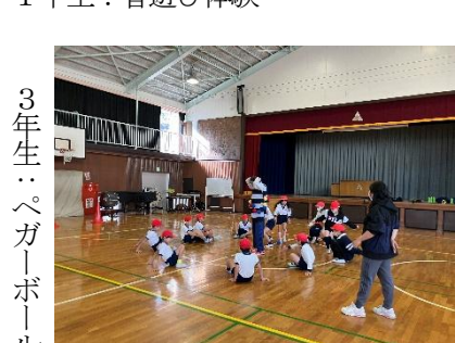
3年生：ペガボール体験