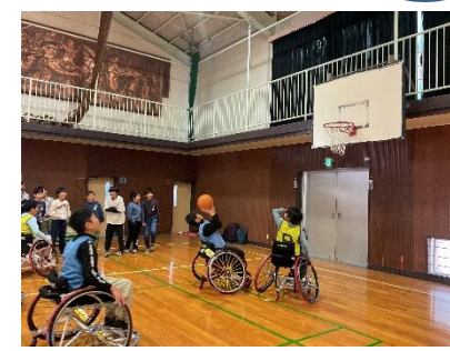
5年生… 車いすバスケット体験